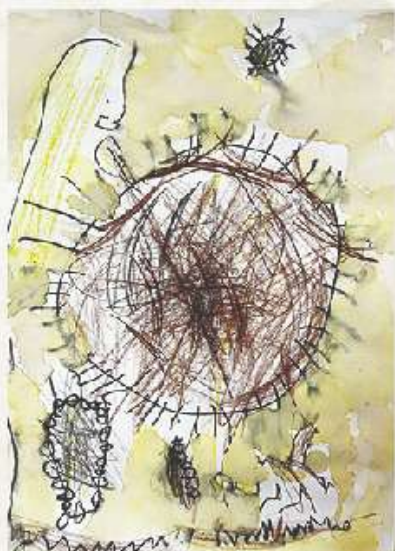
Jaume Ramis Seguí 4 anys