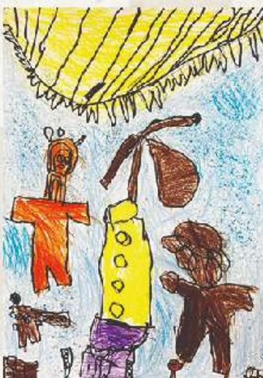
Toni Ferrer Cifre 5 anys