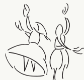
AGRUPACIÓ FESTA PAQESA Mancor de la Vall