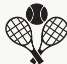
CLUB DE TENNIS MANCOR DE LA VALL